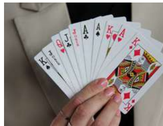
7 Varia arbeidsrecht en sociaal zekerheidsrecht