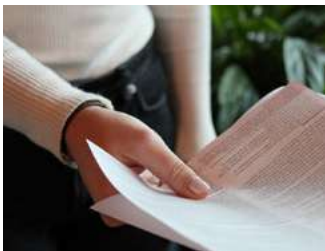
5 Subsidies en tegemoetkomingen