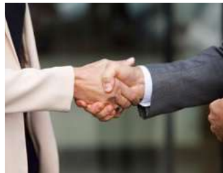
2 Gebruikelijk loon en vrijwilligersvergoeding