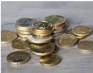
1 Tarieven loonbelasting, premies en heffingskortingen

Deze special bevat actuele cijfers en relevante wet- en regelgeving op onder meer het gebied van de loonbelasting, gebruikelijk loon, de auto van de zaak, de WKR, subsidies voor de werkgever, diverse arbeidsrechtelijke zaken en pensioenen. Aan het einde van dit document is een aantal tabellen met cijfers en tarieven voor 2024 opgenomen.